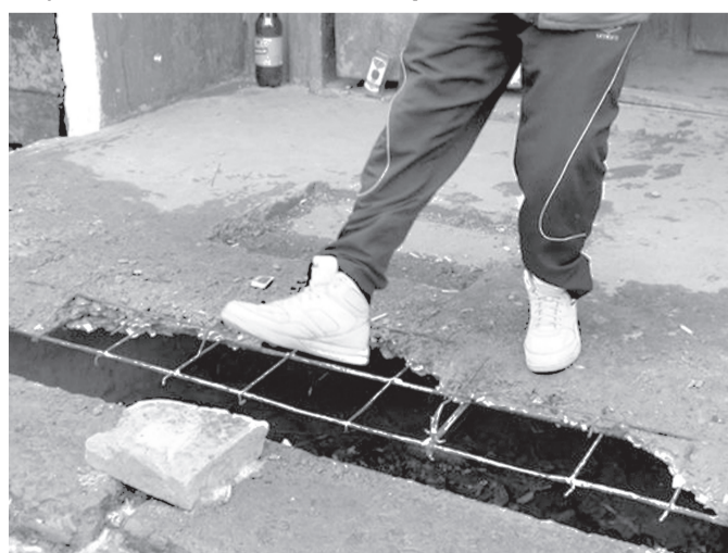
В дыру может пройти ступня

явку от нас по телефону о проблемных ступеньках и пообещала разобратся в этом вопросе.