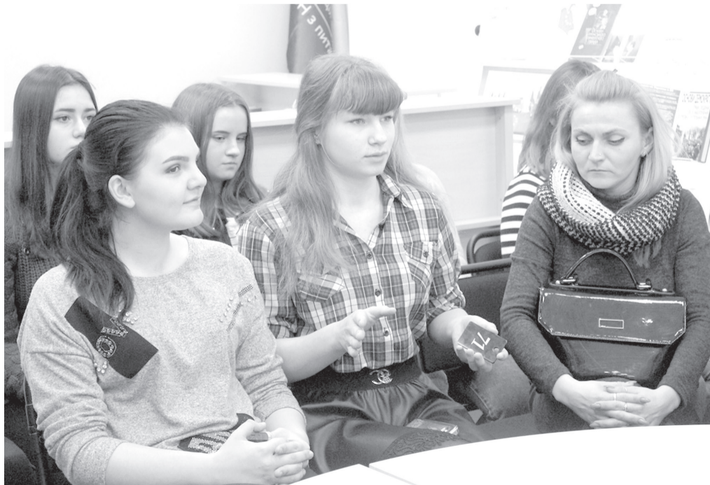
Учні висловлювали свої думки