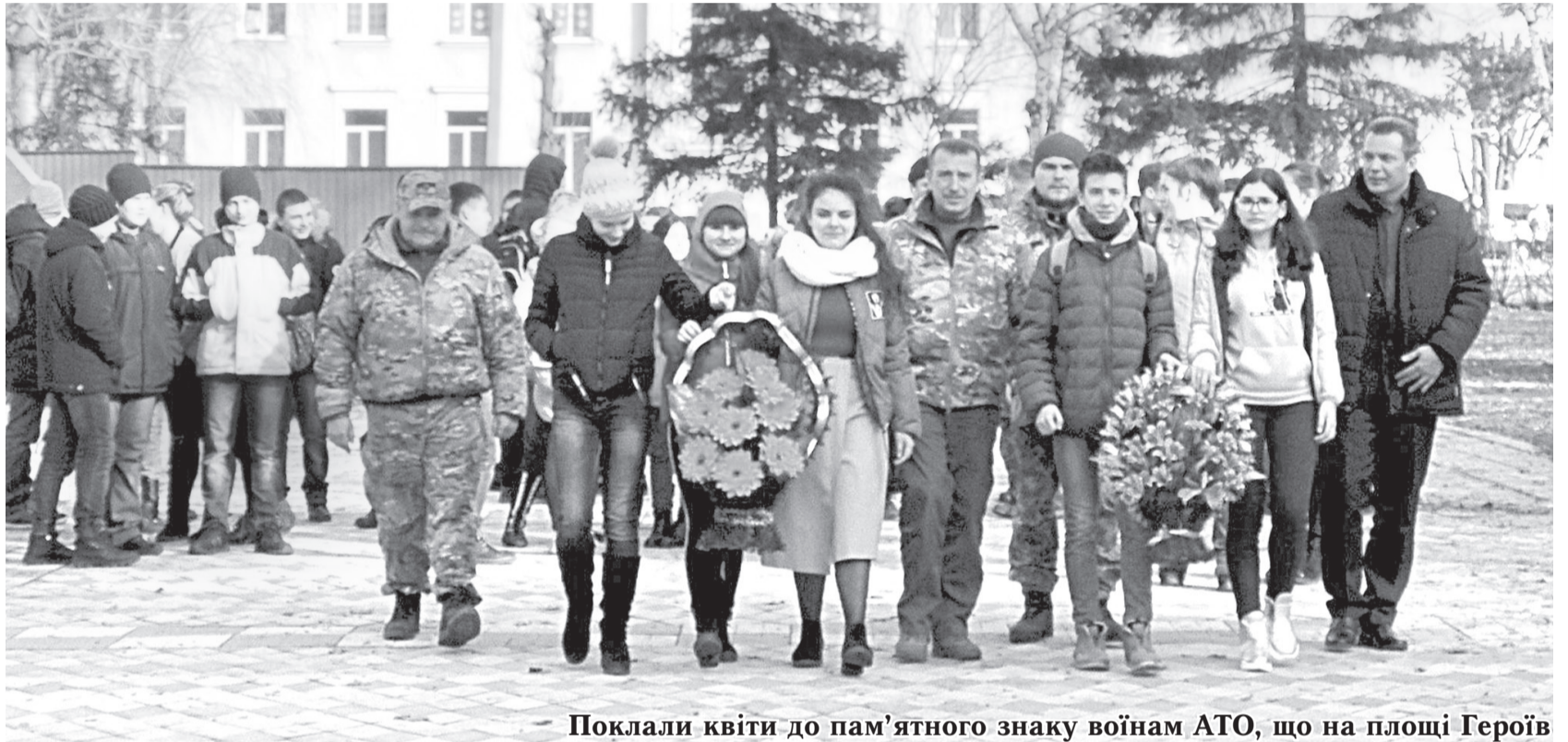
Поклали квіти до пам'ятного знаку воїнам АТО, що на площі Героїв