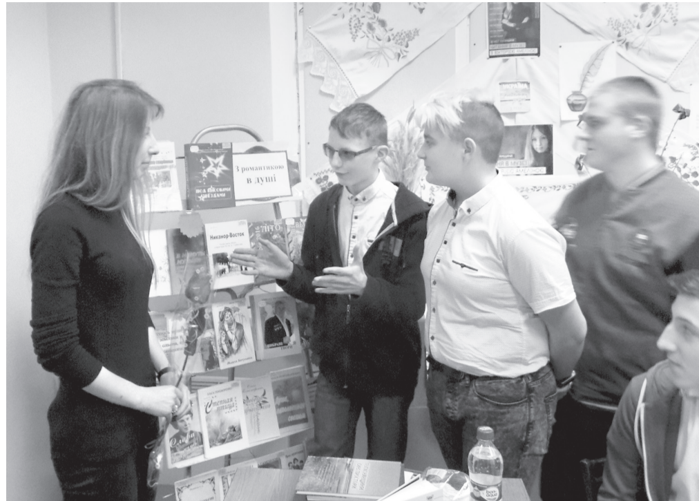
Діти поспілкувалися з письменницею