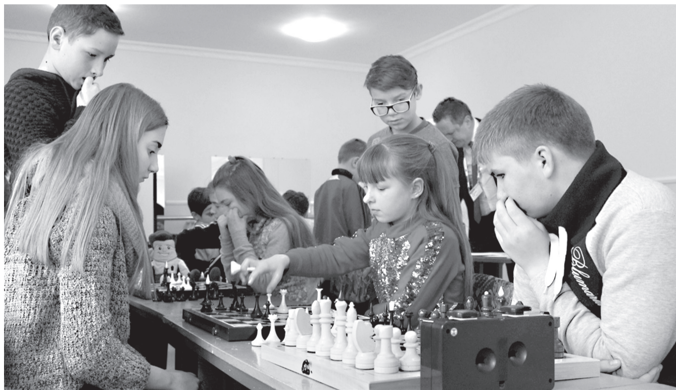
Дети играли сосредоточенно и серьезно

В Попаснянском Доме детского и юношеского творчества девятого февраля состоялся шахматный турнир среди школьников Попасной.