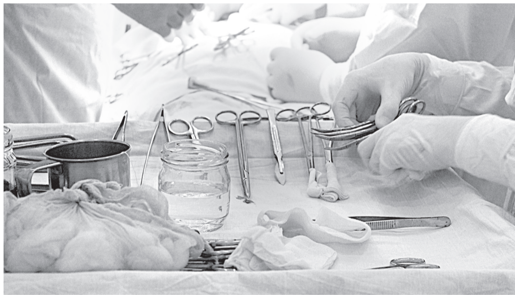
Командная работа спасает жизни

«Здесь очень классный коллектив, все дружно сотрудничают, понимают друг друга, поддерживают. В такой команде приятно работать. А заведующий отделением для меня, как отец! Я беско-