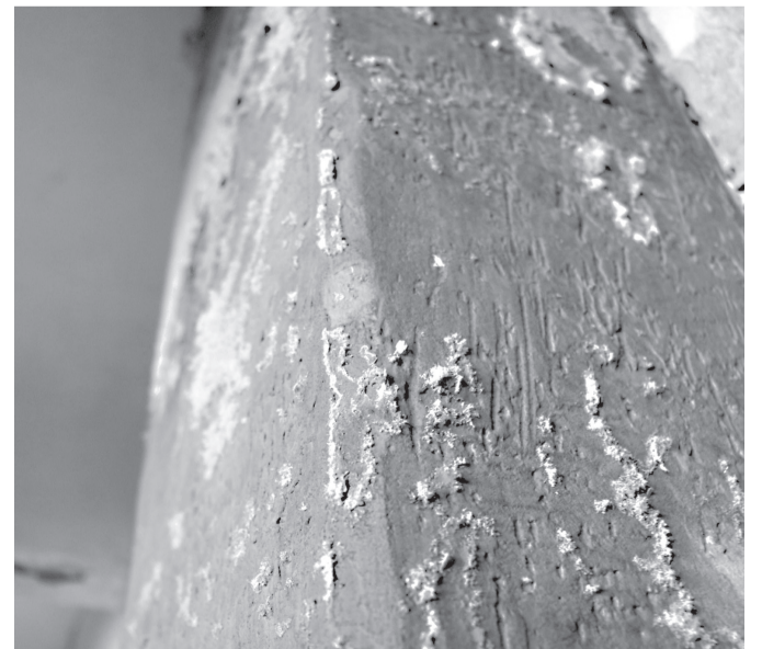
На стінах утворюється грибок