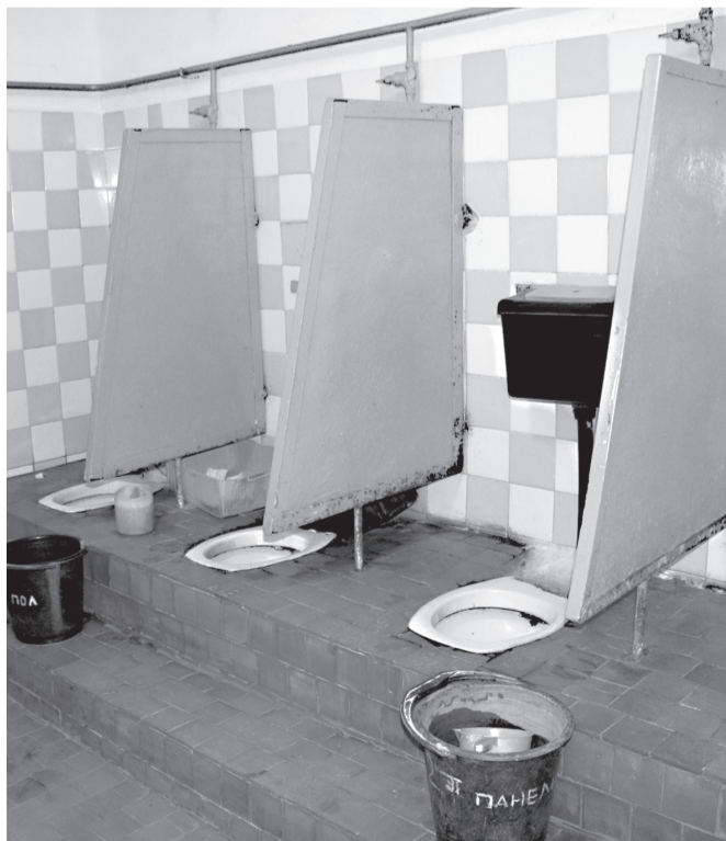
Вбиральні давно не ремонтували