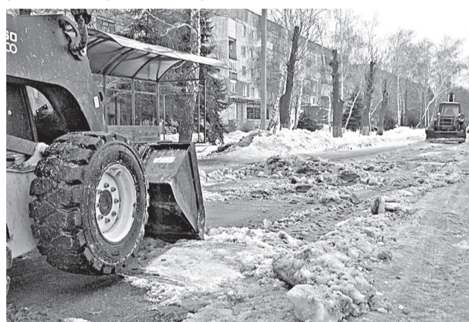
Технике тяжело справиться с задачей

Техника Попаснянского городского предприятия «СКП» расчищает главные дороги города ото льда до самого асфальта. Но ей дается это непросто. На главных улицах города во льду, который лежит на ровном асфальте, образовались ямы и колеи. Это