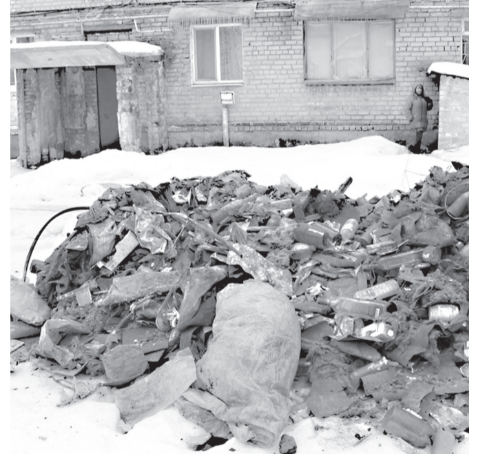
За помощью в вывозе мусора обратились в городской совет

Стоит отметить, что в микрорайоне есть площадки для сбора твердых бытовых отходов. При этом мусор продолжает нака-