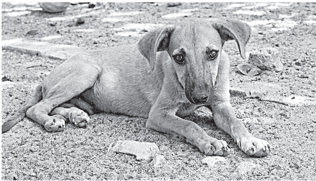
В селищі не можуть вирішити проблему безпритульних собак

Він повідомив, що у нього є заяви від мешканців, які скаржаться на агресивну поведінку собак, буцімто вони на них нападають зграями. І додає, що звертався у селищну раду з проханням звер-