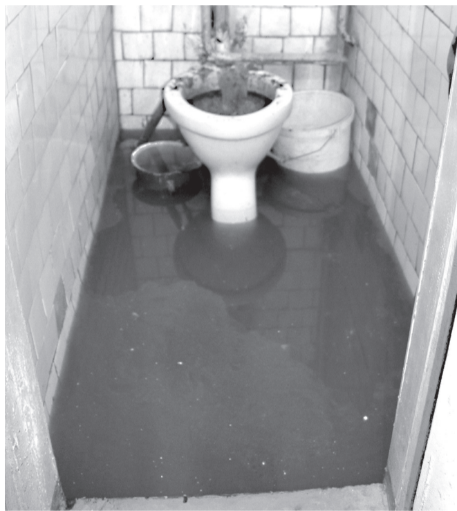
Стоки вытекают на пол из унитаза

Руководитель Попаснянского департамента районного водоканала