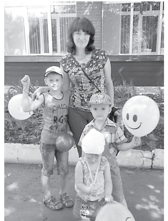
Участь в акції взяли і діти, і дорослі

День захисту дітей - найулюбленіше свято наших дітлахів, яке символізує початок літа. Позаду навчальний рік, попереду довгоочікувані канікули!