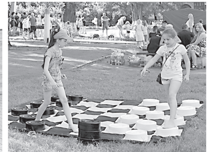
Грали великими шашками