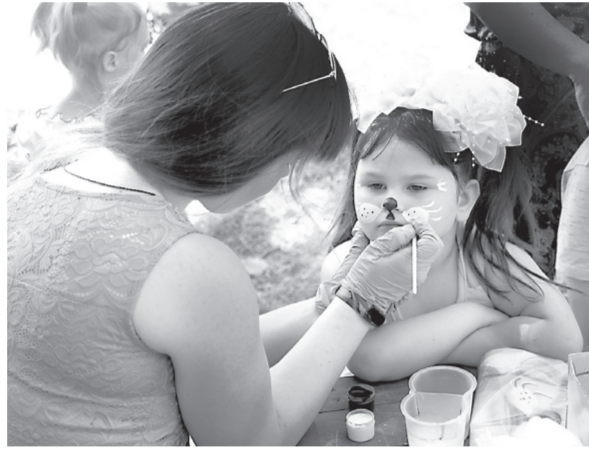
Обличчя прикрашали аквагримом