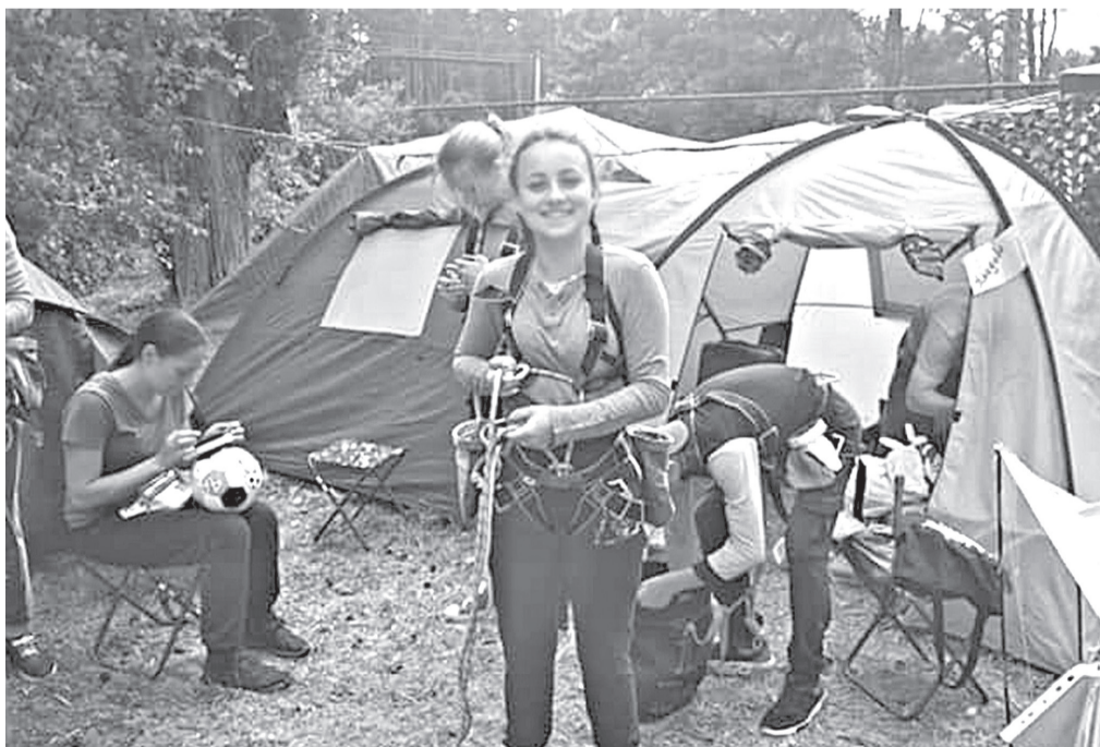
Команда Комишухахи представила наш район