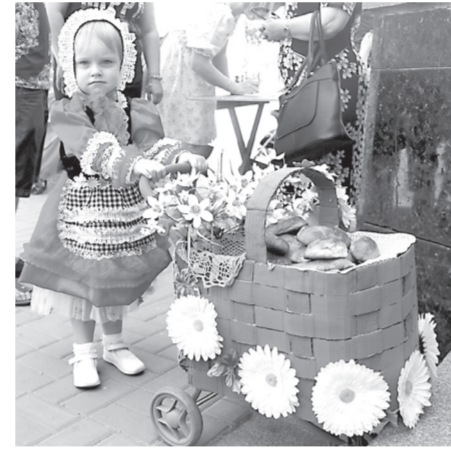
У заході брали участь діти різного віку