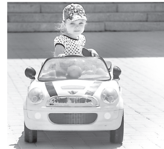
Всі разом проїхали площею