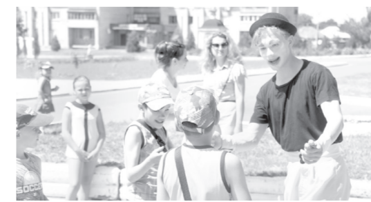
За участь у конкурсах клоун пригощав солодощами