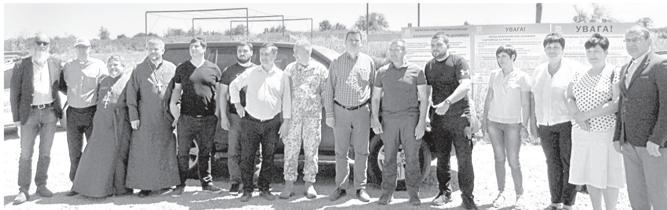
Членів делегації зустріли на контрольно-пропускному пункті міста Золоте

5 червня з робочим візитом до Попаснянського району завітала міжнародна делегація з країн-членів Євросоюзу. До її складу увійшли представники Латвії, Швеції та Естонії.