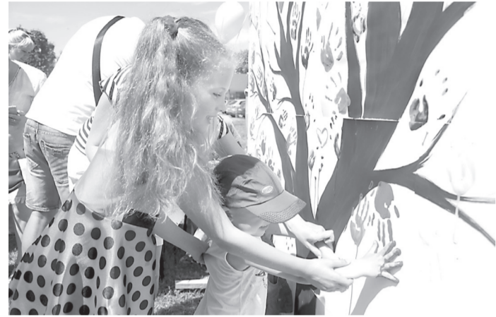
Діти малювали листя кольоровими долоньками