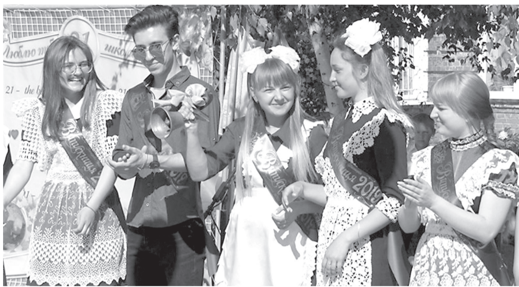
Для випускників - це перший крок у доросле життя