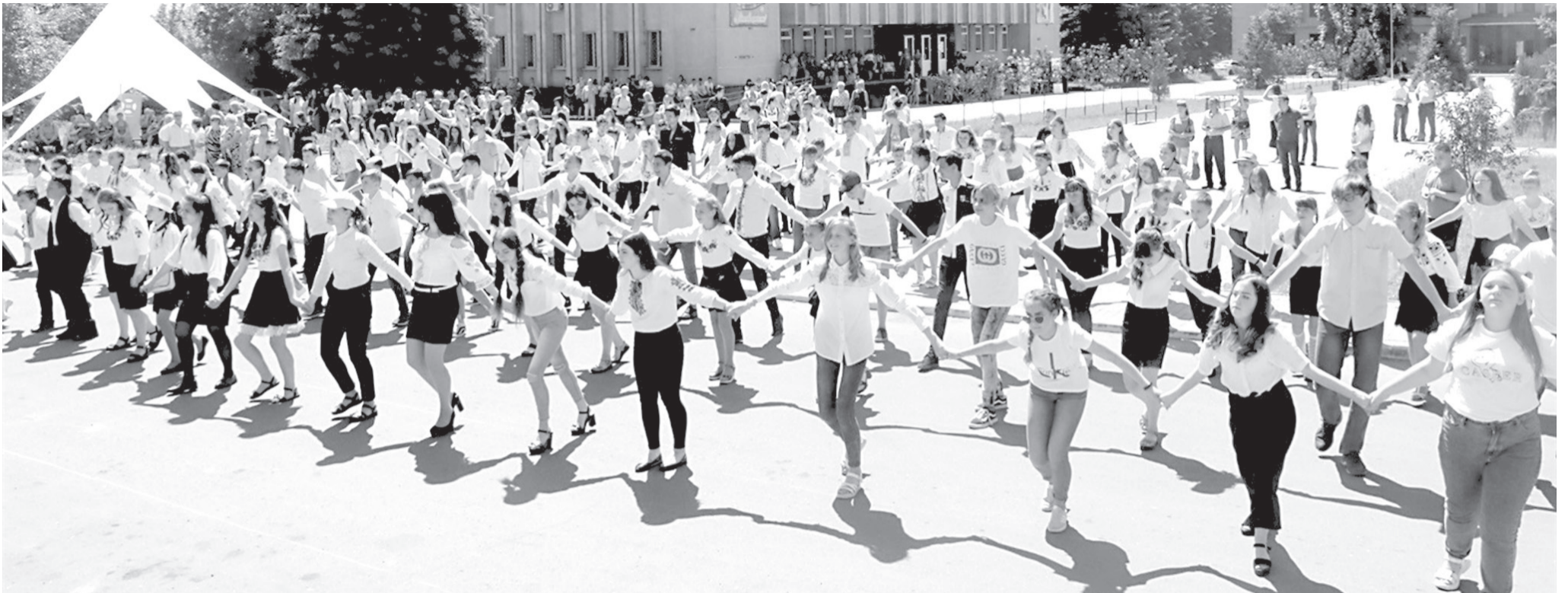
Початком заходу став яскравий флешмоб

31 травня в Попасній на площі Миру відбувся освітній форум, який зібрав разом сотні учнів з батьками та вчителів зі шкіл міста та району.