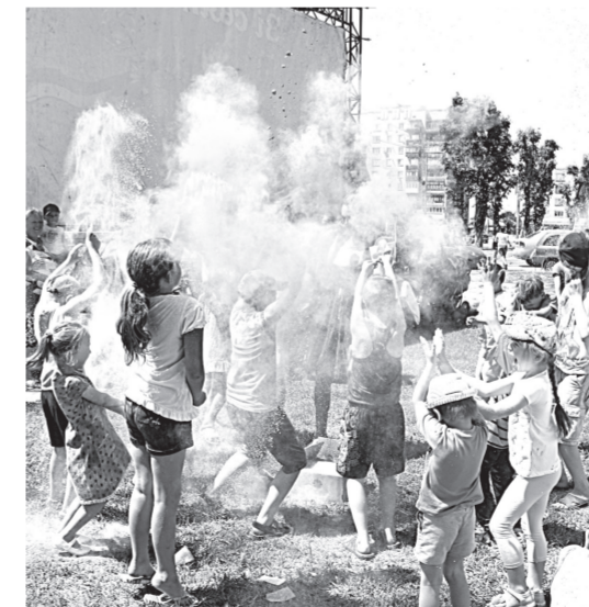
Кидалися фарбами холі