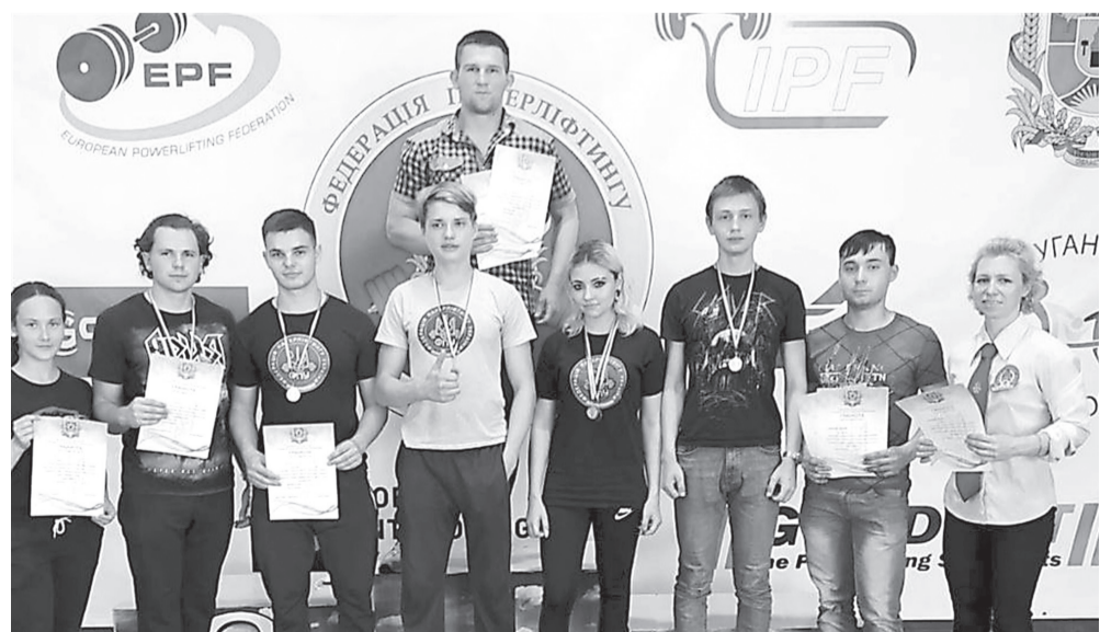
Попасняни вкотре підтвердили свій високий рівень підготовки