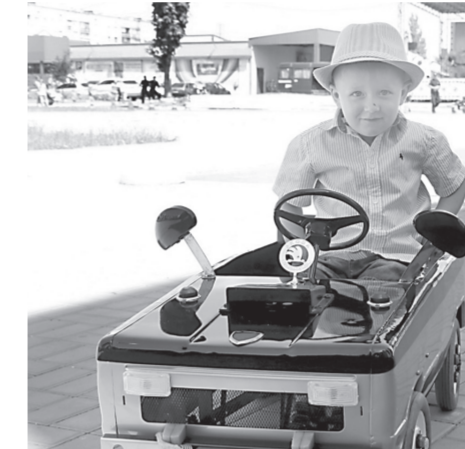
Транспорт дітей вражав різноманіттям

1 червня на честь Міжнародного дня захисту дітей в Попасній провели фестиваль-конкурс дитячого транспорту «Малюють рулять». Учасниками конкурсу стали діти, які змагались у оригінальності та творчому підході до оформлення своїх транспортних засобів у всіх його видах.