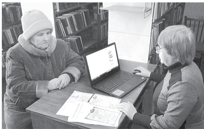
Надають різну інформацію

Бібліотекарі забезпечені необхідними інформаційними, роздатковими матеріалами, що дає змогу громадянам своєчасно отримати інформацію про зміни в законодавстві та про пільги, які вони можуть отримати у районних установах. Також мешканці користуються