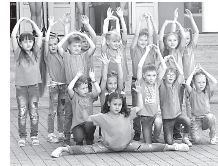
Виступали талановиті діти